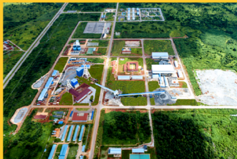
大冶弘盛40万吨高纯 阴极铜清洁生产项目