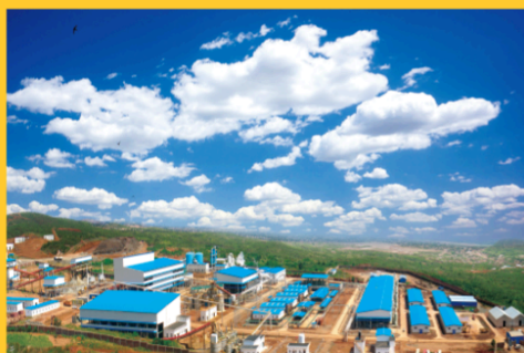
蒙古图木尔廷敖包锌矿 项目