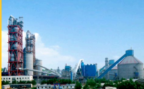
河南天瑞卫辉水泥厂 工程