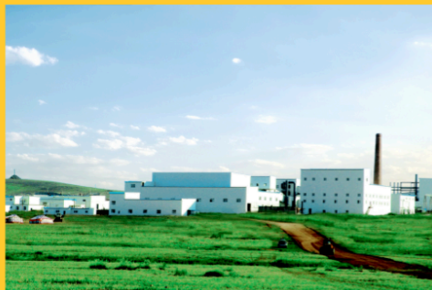
铜陵有色绿色智能 铜基新材料项目