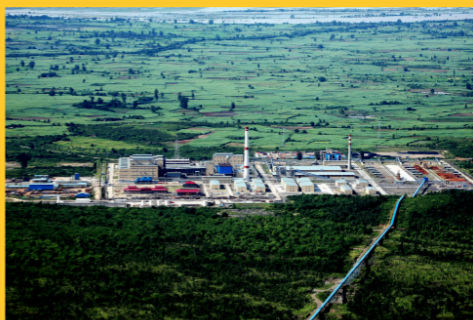
中色正元年产6万吨锂电 正极材料项目