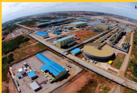
刚果（金）希图鲁湿法 冶炼工程