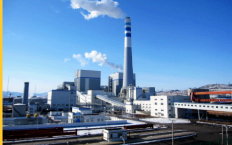
中电投辽宁朝阳燕山 湖电厂工程